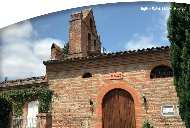
Eglise Saint-Lizier - Rebigue

Une relique du saint évêque fut transférée de la cathédrale Saint-Lizier d'Ariège à l'église de Rebigue. Une dévotion populaire se développa rapidement (Saint-Lizier est invoqué pour la guérison des maladies de la peau, eczéma, croûtes de lait, ...) et perdure encore aujourd'hui.