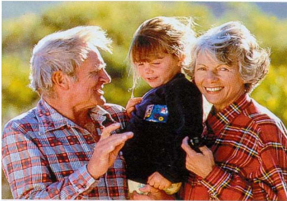
Pg. 66 ; S.M.(9) N° 273