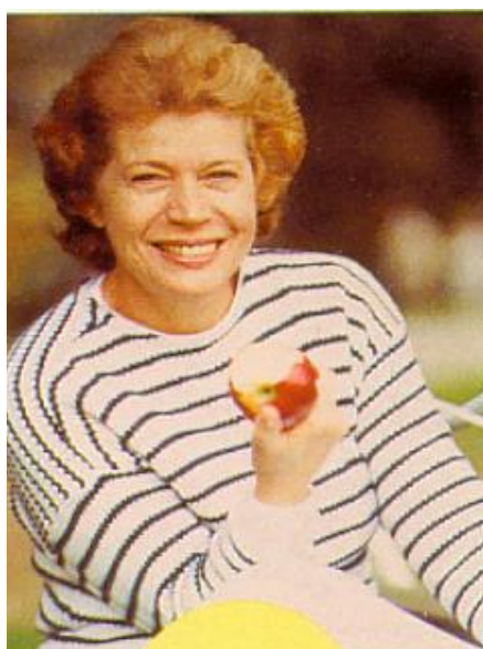
Le grand Médecine Après 40 ans comment les éviter les kilos qui s'accrochent Pg.200 ; RàS(4) N° 115