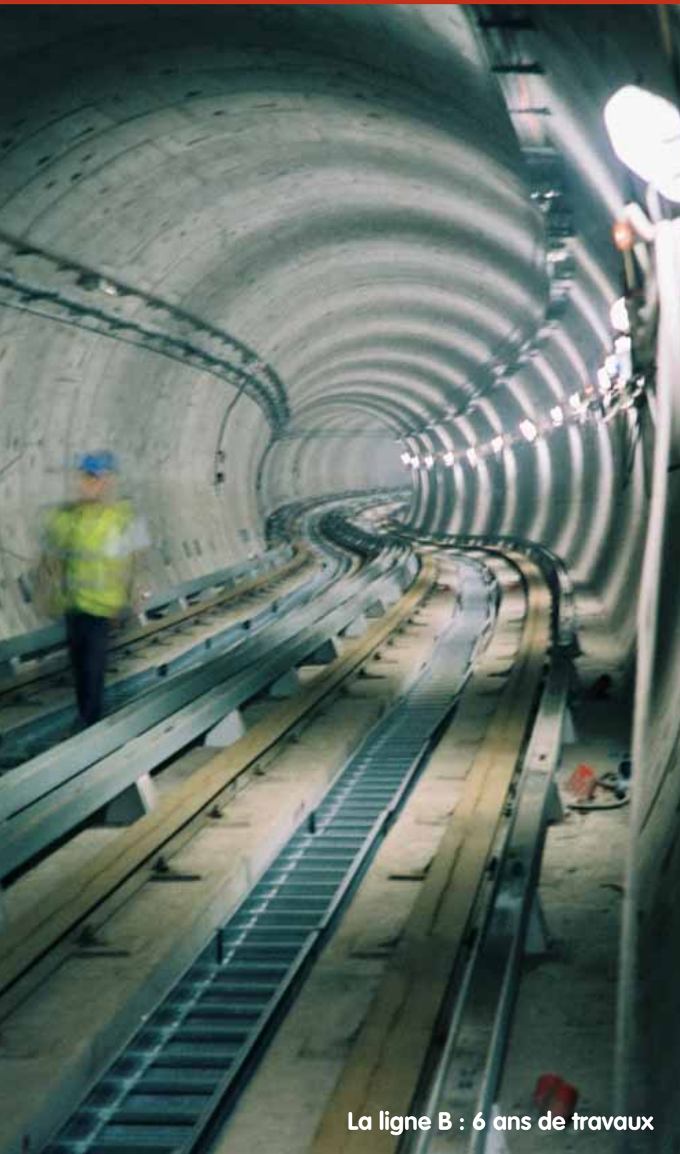
La ligne B : 6 ans de travaux

Au cœur des préoccupations des élus du Sicoval, la question des transports et des déplacements trouve aujourd'hui une réponse forte avec la mise en service de la ligne B du métro. La station de Ramonville-Saint-Agne place en effet l'entrée Nord du territoire du Sicoval à moins de 15 minutes du centre ville de Toulouse !