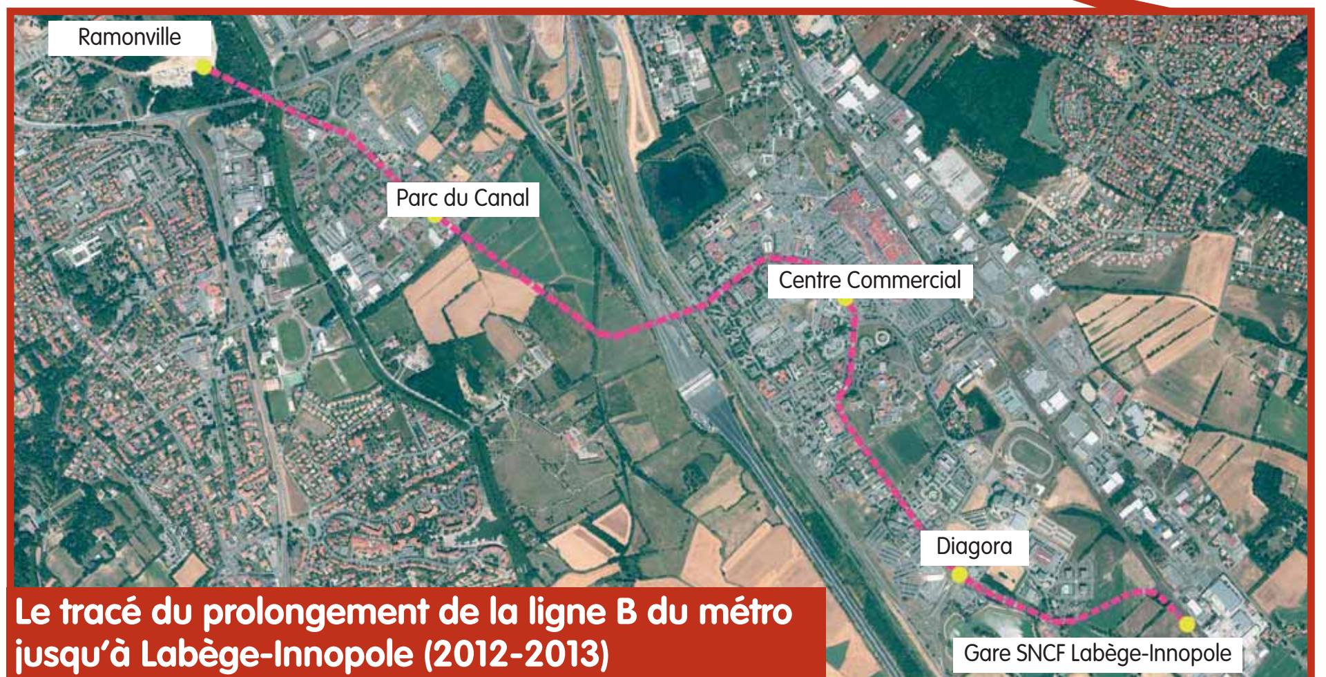
Le tracé du prolongement de la ligne B du métro jusqu'à Labège-Innopole (2012-2013)