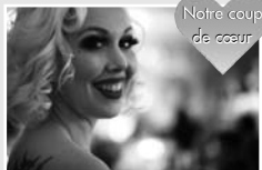
Notre coup de cœur