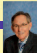
Vice-Président en charge de l'Aménagement de l'espace et du PLH.

« Le développement de l'habitat est une priorité pour les élus du Sicoval. Quel est le bilan sur les deux dernières années ?