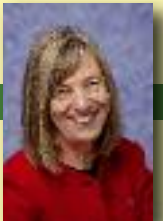
Vice-Présidente en charge de l'Agenda 21