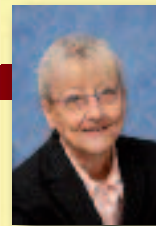
Vice-Présidente en charge de la Solidarité et de la Cohésion sociale

Mon expérience de Maire m'a appris qu'il faut soutenir les associations culturelles et sportives, les bibliothèques municipales, etc., pour que ces activités soient accessibles à tous et éviter la ségrégation sociale. Il faut aussi créer des événements, comme les Randovals, qui fédèrent des jeunes, des seniors, des personnes handicapées... Il faut également travailler sur l'aménagement du territoire et des zones habitables, pour ne pas créer des quartiers où les gens rentrent chez eux et s'ignorent, ou des lieux fermés comme les résidences seniors. Au contraire, il faut favoriser la mixité sociale et générationnelle, aménager des espaces de rencontre (jardins familiaux...), accueillir des commerces de proximité, prévoir des accès pour les handicapés, créer des axes où les gens se croisent... »