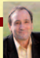
Vice-Président en charge de la Culture, du Sport et des Loisirs

En matière de politique pour la jeunesse et, notamment, de loisirs éducatifs, il faut prendre en compte la mobilité des jeunes qui, par exemple, dans leurs collèges et lycées, nouent des liens avec des camarades habitant d'autres communes. Cela impose une approche globale du territoire. Il faut maintenir dans les communes des lieux d'accueil et d'initiative pour les jeunes, avec des adultes référents, et il faut aussi créer une synergie entre ces lieux dans un projet éducatif commun. »