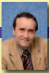
Vice-Président en charge de l'Économie et de l'Emploi