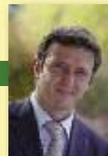
Vice-Président en charge de l'Environnement

« La lutte contre le changement climatique est un problème planétaire. Comment notre Communauté d'Agglomération peut-elle y contribuer ? Nous devons agir sur nos émissions de gaz à effet de serre, nos consommations énergétiques et le recours aux énergies renouvelables. C'est tout l'enjeu du Plan climat énergie territorial, qui constitue un volet entier de notre Agenda 21. Le Sicoval doit être exemplaire, mais nous ne pourrions réussir seuls. Aussi le Plan a-t-il été co-écrit avec les habitants, les acteurs économiques et associatifs, qui ont été source de propositions. »