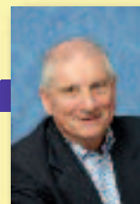
Vice-Président en charge des Transports et des Déplacements.

En terme de déplacements, le métro, dont la fréquentation est évaluée à 35 000 voyageurs par jour, délesterait le Palays d'une partie des 130 000 véhicules qui l'empruntent quotidiennement et, de ce seul point de vue, le prolongement de la ligne B est un service rendu à l'ensemble de l'agglomération. La gare multimodale permettra de faire converger différents modes de déplacement collectifs (train, métro, bus) ou individuels (vélos, voitures pour lesquelles le stationnement sera prévu). Mais ce prolongement constituera l'axe structurant d'un véritable « réaménagement » de l'espace du Sud-Est toulousain qui, au-delà des seules zones d'activités de l'Innopole et du Parc du Canal – elles-mêmes appelées à être requalifiées – concernera l'ensemble des communes du Nord du Sicoval. L'arrivée du métro à Labège aura aussi un effet d'intégration urbaine fort sur le Sud du territoire. Il s'agit donc bien là d'un projet d'intérêt d'agglomération et c'est tout à l'honneur du Sicoval d'avoir su le porter. »