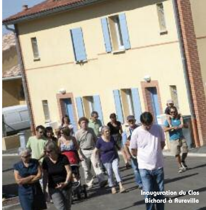
Inauguration du Clos Bichard à Aureville