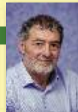
Vice-Président en charge de la Collecte, du Traitement et de la Valorisation des déchets

« La gestion des déchets est un autre volet de la politique Environnement du Sicoval. Comment expliquer que le tonnage des ordures ménagères collectées n'augmente pas alors que la population du territoire croît ? Notre politique préventive se traduit par une production annuelle d'ordures ménagères par habitant largement inférieure à la moyenne nationale (238 kg contre 350). Pour diminuer encore les tonnages, nous encourageons le compostage en pavillon et en immeuble. Nous avons mis en place un service de broyage à domicile pour les déchets verts. Par ailleurs, les efforts des communes et des habitants, qui ont optimisé leurs collectes, nous ont permis de maintenir la redevance au même tarif depuis 2009. Nous souhaitons maintenant mettre en place un Plan local de prévention pour réduire nos ordures résiduelles de 7 % en 5 ans, conformément aux objectifs du Grenelle Environnement. »