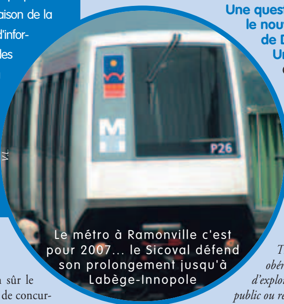
Le métro à Ramonville c'est pour 2007... le Sicoval défend son prolongement jusqu'à Labège-Innopole