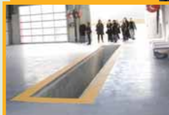
Une fosse de 10 mètres de long pour l'entretien des poids lourds avec un dispositif de récupération des huiles usées