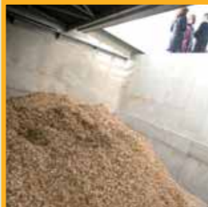
85 % des besoins de chauffage sont assurés par la chaudière au bois