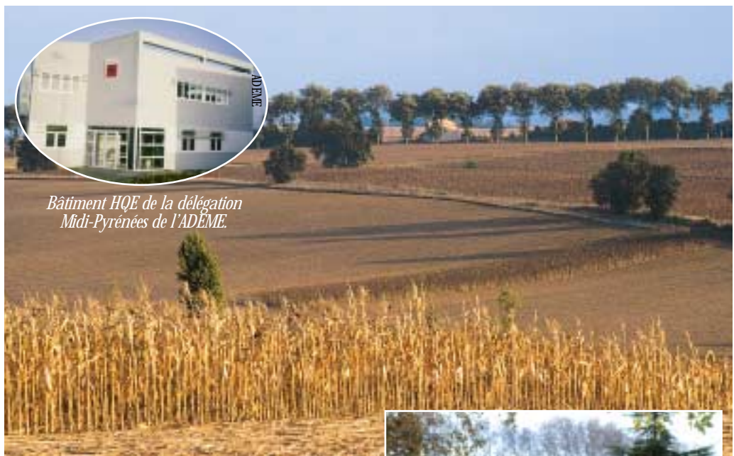
Bâtiment HQE de la délégation Midi-Pyrénées de l'ADEME.

Concernant les actions qui ont une portée sur la vie quotidienne des habitants, le tri sélectif et la valorisation des déchets viennent immédiatement à l'esprit. Toute une organisation est mise en place, qui commence par l'esprit de citoyenneté de chacun pour aller jusqu'aux questions techniques des filières de recyclage. Mais d'autres décisions sont à mettre en exergue, comme le démarrage du programme Rivières qui fait partie intégrante de la Charte d'Aménagement du Sicovall et s'inscrit dans le cadre du développement durable. 91 km de cours d'eau ont été répertoriés afin d'être aménagés pour limiter les risques de crues et pour maintenir les espaces naturels. Les berges des ruisseaux seront mises en sécurité contre l'érosion des sols par des bandes enherbées et des haies ; la végétation aquatique sera restaurée afin de rétablir ses fonctions biologiques et paysagères ; des zones de rétention seront mises en place pour réduire les vitesses de ruissellement et réguler les débits. Une expérience sur le ruisseau du Tissieu a montré l'intérêt et la faisabilité de ce programme. L'investissement financier est important : 55 millions de francs seront débloqués sur huit ans selon un plan de financement dans lequel l'État, la Région, le Département et l'Agence de l'eau sont