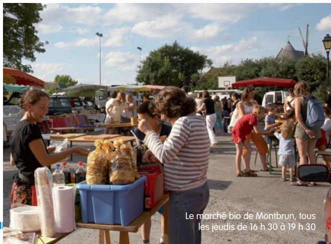
Le marché bio de Montbrun, tous les jeudis de 16 h 30 à 19 h 30