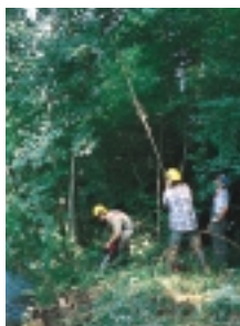
Chantier d'entretien des berges.

Afin d'éviter la formation de ces obstacles sur les berges et dans le lit du cours d'eau, la végétation sera régulièrement entretenue.