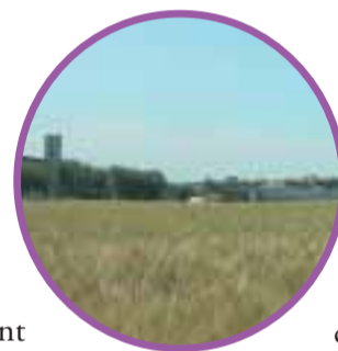
Vues du site Visenc