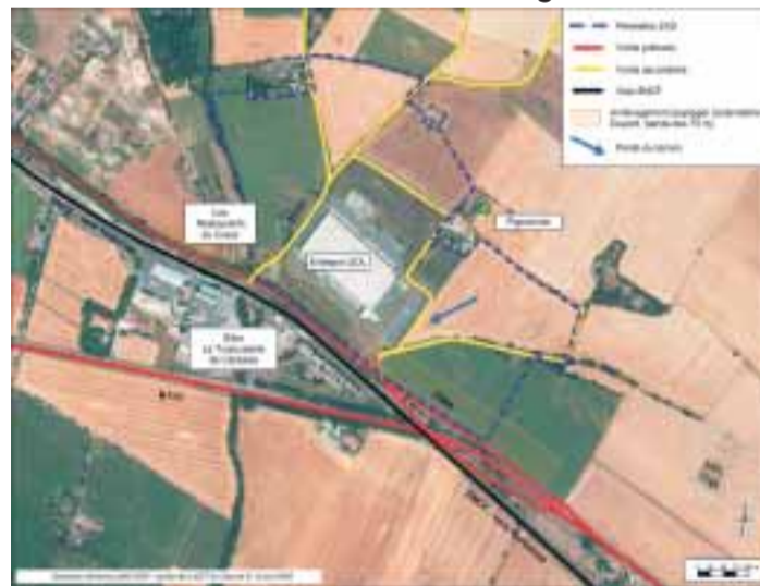
Le site du Visenc sur Baziège