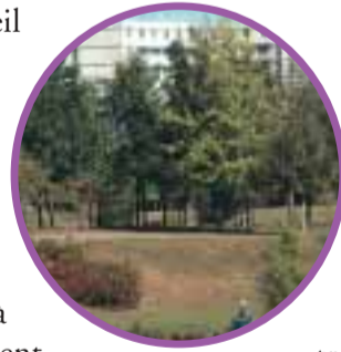
Aménagements paysagers sur Labège-Innople