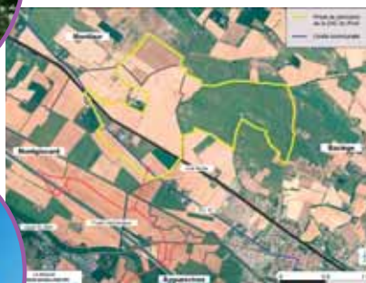
Le site du Rivel