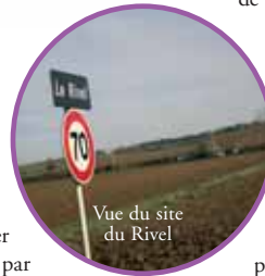
Vue du site du Rivel

Le schéma de voirie s'articulera autour de plusieurs voies primaires, sur lesquelles se raccorderont des voies secondaires, de manière à aménager progressivement le site quartier par quartier. Ce schéma intégrera aussi des cheminements piétons et cycles. Il sera le garant de la cohérence de l'aménagement du parc d'activités sur le long terme.